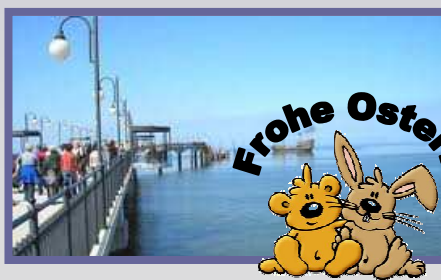
Misdroy - Seebrücke

Am heutigen Ostersonntag unternehmen Sie einen Ausflug zum beliebten Seebad nach Misdroy, das durch seine restaurierten Villen und der Mole seine Besucher in den Bann zieht. Man kann auch sagen, Misdroy ist die polnische Antwort auf Sylt oder St. Peter Ording.