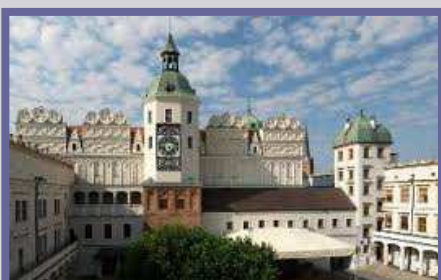
Das Schloss der Pommerschen Herzöge

Nach dem Frühstück werden Sie von einer deutschsprachigen Reiseleitung in Empfang genommen, mit ihr zusammen erkunden Sie die zahlreichen Sehenswürdigkeiten der Stadt. Der Stadtrundgang führt Sie zum Schloss der pommerschen Herzöge und in die Altstadt.