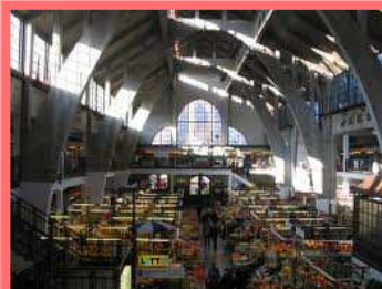
Breslau – Markthalle

Mindestteilnehmerzahl 16 Personen für die Durchführung der Reise. Reiseabsagefrist bis 4 Wochen vor Reisebeginn.