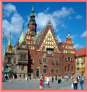
Breslau – Rathaus