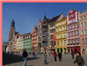
Breslau – Ring